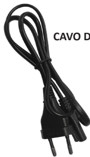
CAVO DI RETE