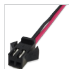
Cavetto con connettore