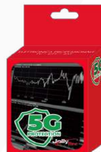
Imballo 14 x 12 x 5 cm