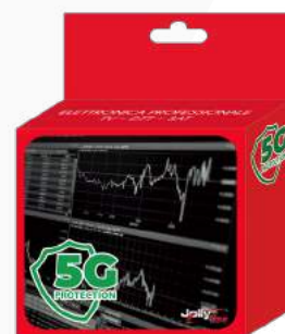
Imballo 13 x 14 x 5 cm