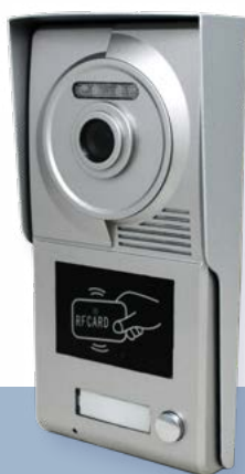
PE 1BM 321013