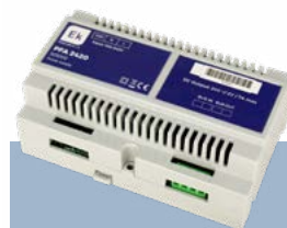
PFA 2420 323002